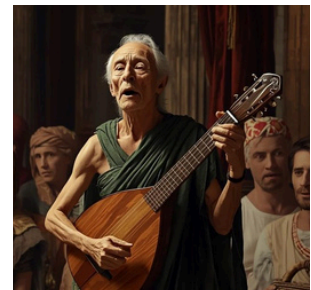
un chanteur (un aède)

Ulysse pleure parce qu'il entend, pendant le festin, un chanteur raconter l'histoire de la guerre de Troie.