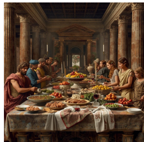
un festin, un banquet