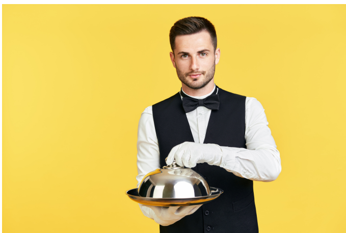
Un laquais = un serviteur