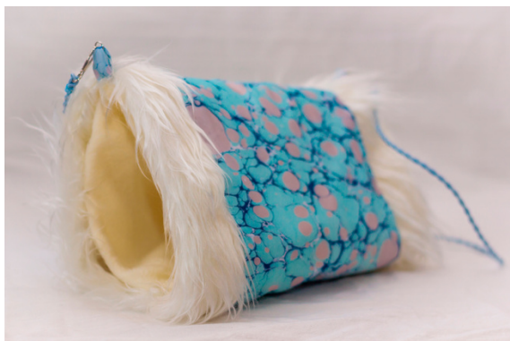
Un manchon pour ne pas avoir froid aux mains