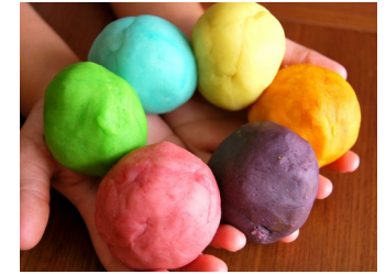
Pâte à modeler