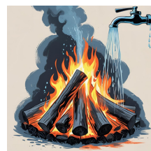
...éteint le feu.