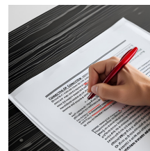
...corrige ses copies.