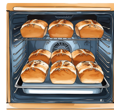
...fait cuire le pain.