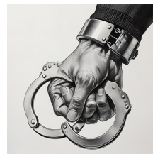
...menotte un suspect.