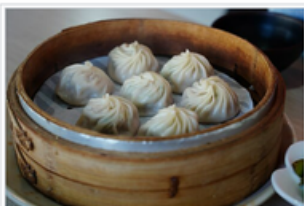
Xiaolongbao dans des paniers vapeur en bambou.